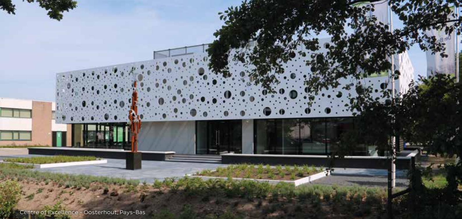
Centre of Excellence - Oosterhout, Pays-Bas