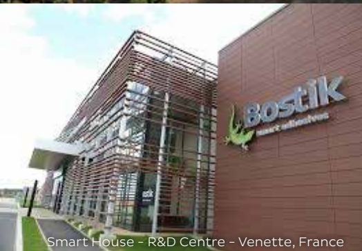
Smart House - R&D Centre - Venette, France